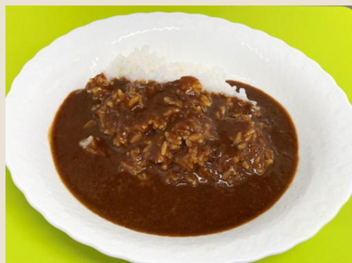
サンホーム カレーソース