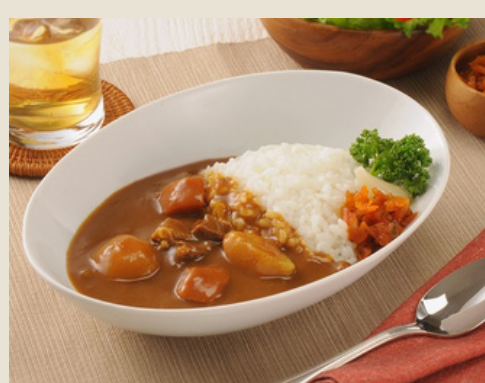
サンホーム ごろごろ野菜のビーフカレー