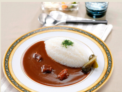
サンホーム 欧風ビーフカレー