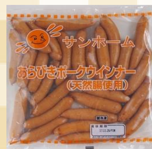
サンホーム 粗挽きポークウインナー天然腸約18g 規格：450g