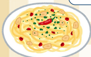
サンホーム ピュアオリーブオイル 規格：800g