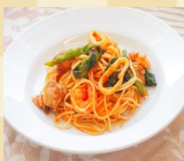
サンホーム ケチャップチューブ 標準 規格：1Kg