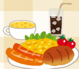
サンホーム ミニクロワッサン 規格：約19g×10