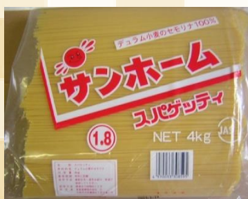
サンホーム スパゲティ1.8mm 規格：4Kg