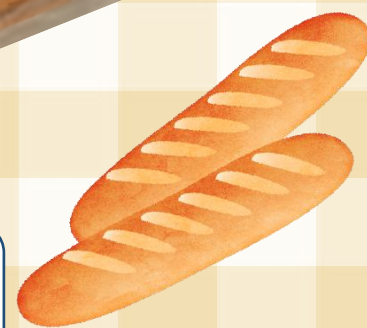
サンホーム バゲット 規格：約248g