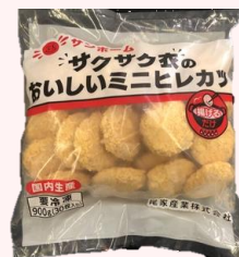
サンホーム サクサク衣のおいしいミニヒレカツ

規格:750g/8袋 * 2合 温度帯:冷凍 賞味期間:365日 商品CD:5597116