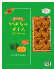
サンホーム かぼちゃダイス 皮無し中国産13mm

規格:500g/24袋 温度帯:冷凍 賞味期間:720日 商品CD:5475353