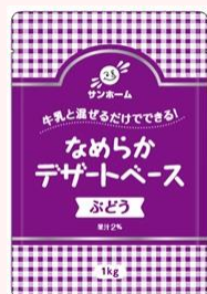
サンホーム なめらかデザートベース ぶどう 規格:1kg/6袋 温度帯:常温 賞味期間:390日 商品CD:5646548