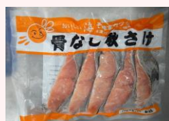
おいしい海 骨なし秋さけ(そのままクック)60g・70g

規格:60g×5/16袋*2合 70g×5/14袋*2合 温度帯:冷凍 賞味期間:730日 商品CD:(60g)4773863 (70g)4646488