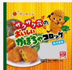
サンホーム サクサク衣のおいしいかぼちゃコロケ

規格:500g/24袋 温度帯:冷凍 賞味期間:720日 商品CD:5475353