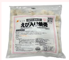
燦宝夢 えび入り焼売15(約50個入)

規格:15g×10/10袋 * 4合 温度帯:冷凍 賞味期間:540日 商品CD:5316007