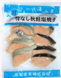
おいしい海 骨なし秋鮭塩焼き

規格:1kg/10袋 温度帯:常温 賞味期間:360日 商品CD:4635307