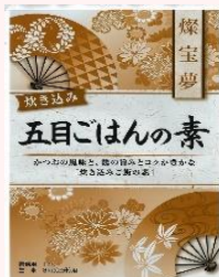
燦宝夢 五目ごはんの素炊き込み用

9月といえば、厳しい暑さが少し和らぎ、行楽地へ出かける人が増えてくる季節！行楽地で食べるお弁当のおかずにとぴったりの商品をご紹介します。