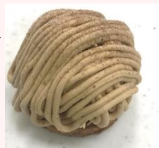
サンホーム 渋皮栗モンブラン 規格:60g×4/18BL 温度帯:冷凍 賞味期間:365日 商品CD:5020393